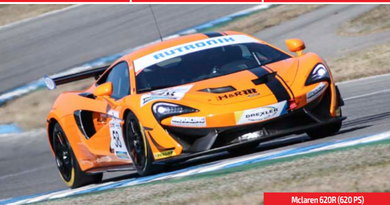
McLaren 620R (620 PS)